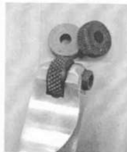
Cleo använder lösa grävthjul som går att byta ut för att skapa olika ystukturer. Ett kraftigt rör gör det lätt att trycka hårt mot plåten.